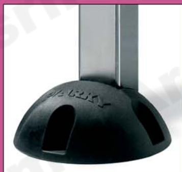
Modèle communautaire enregistré Nr. 00002521-0004