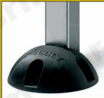
Modèle communautaire enregistré Nr. 000025721-0004