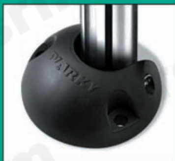
Modelo comunitario registrado Nr. 000025721-0002