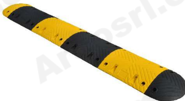
ARC 70 10 KM/H