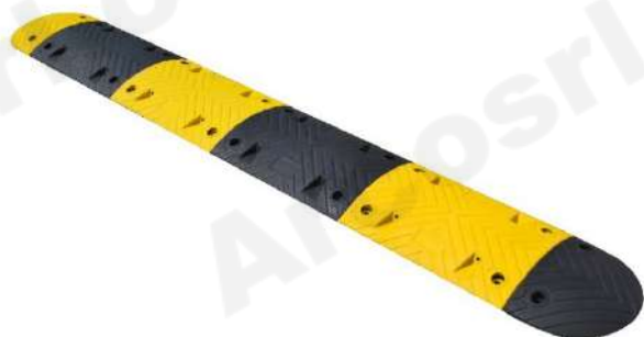
ARC 50 20 KM/H