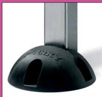
Modello comunitario registrato Nr. 000025721-0004