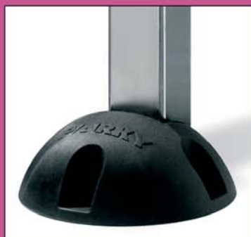
Modèle communautaire enregistré Nr. 00002521-0004