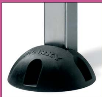
Modelo comunitario registrado Nr. 00002521-0004