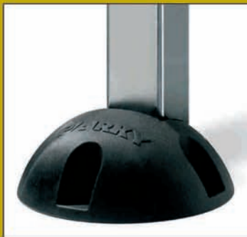
Modello comunitario registrato Nr. 000025721-0004