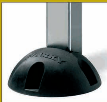
Modèle communautaire enregistré Nr. 000025721-0004