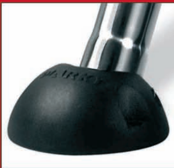
Modelo comunitario registrado Nr. 000025721-0002