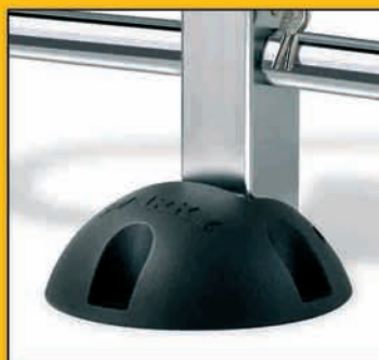
Modèle communautaire enregistré Nr. 000025721-0004