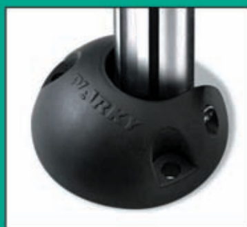
Modelo comunitario registrado Nr. 000025721-0002