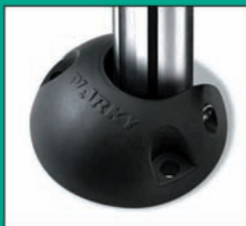
Modelo comunitario registrado Nr. 000025721-0002